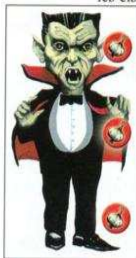
Le Vampire Il déteste l'ail.