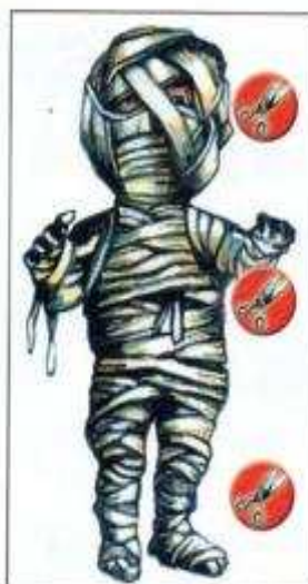
La Momie Elle déteste les ciseaux.