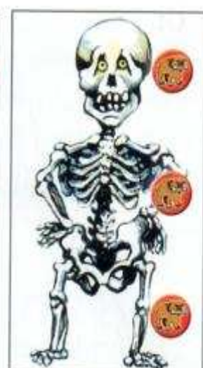
Le Squelette Il déteste le chien.