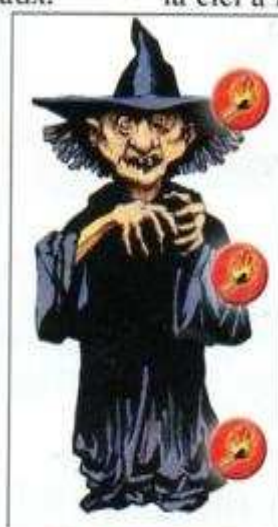
La Sorcière Elle déteste la flamme.