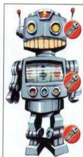
Le Robot Il déteste la clef à molette.