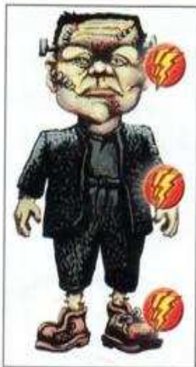
Frankenstein Il déteste l'éclair.

Voici les 7 déguisements du jeu, et dans le petit cercle rouge, la chose que chacun déteste le plus et qui indique les cases du plateau où il n'a pas le droit d'aller.