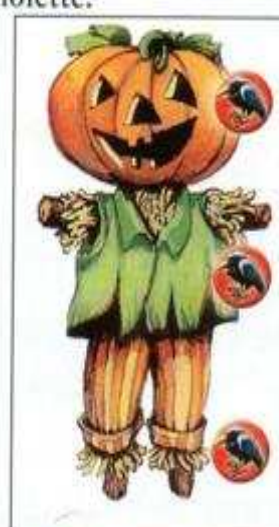
L'Épouvantail Il déteste le corbeau