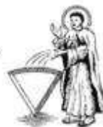
Case « Raccourci »

Sur le plateau se trouvent 6 cases sur lesquelles est dessiné à chaque fois un petit triangle de couleur différente. Lorsque vous vous arrêtez sur cette case, rendez-vous directement à la case Quartier Général de Catégorie de la même couleur. Si vous répondez correctement à la question qui vous sera posée, vous gagnez le triangle marqueur.