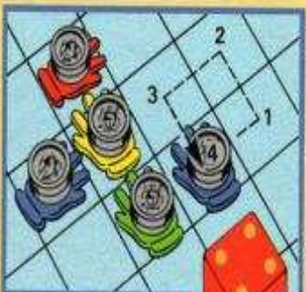
D. Déplacement de 4 cases

Vous ne pouvez pas revenir sur vos pas mais vous avez le droit de vous replacer sur la case que vous venez de quitter après avoir emprunté un autre chemin (voir schéma ci-dessous).