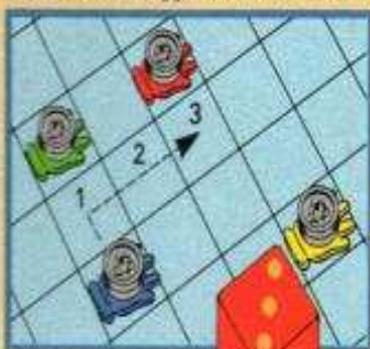
A. Déplacement de 3 cases