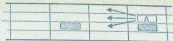
Schéma 2: Dans ce cas, le coureur A ne peut pas avancer sur la case X.

Schéma 1: 3 déplacements permis au coureur A.