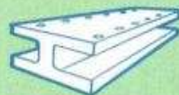
Sans fuite les Eaux