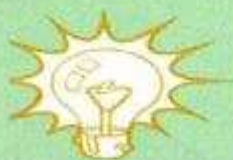
Idee Lumineuse Electricité