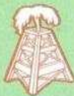
Frères Dupuit Pétrole