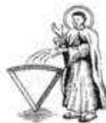
Case « Raccourci »

Lorsque vous vous arrêtez sur une de ces cases, rendez-vous directement à la case Quartier Général de Catégorie de la même couleur. Si vous répondez correctement à la question qui vous est posée, vous gagnez le triangle marqueur.