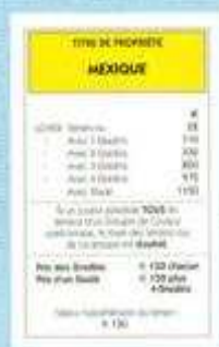
Les titres de propriété