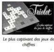
Le plus captivant des jeux de chiffres

© & © Copyright 1996 PBM France - Edité par Jeux PBM