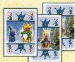
Le joueur ramasse !

Lorsqu'un joueur se retrouve avec des cartes posées devant lui pour une valeur totale de 6 points ou plus, ça signifie que le Roi n'en peut vraiment plus ! Ce joueur doit ramasser alors toutes les cartes posées face visible se trouvant devant tous les joueurs, et les poser dans son propre paquet de plis, face cachée. Indépendamment de qui a joué la carte précédente, c'est le joueur qui ramasse le pli qui débute un nouveau tour, en jouant une carte de sa main devant un joueur comme d'habitude. Le jeu se poursuit ensuite dans le sens des aiguilles d'une montre comme d'habitude.