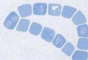
1• Chemin de Poucet

A la partie suivante, c'est un autre enfant qui devient Poucet.